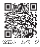
公式ホームページ

〒897-8501 鹿児島県南さつま市加世田川畑2648番地 (南さつま市役所観光交流課内) ☎0993-76-1609 mail sand@sand-minamisatsuma.jp