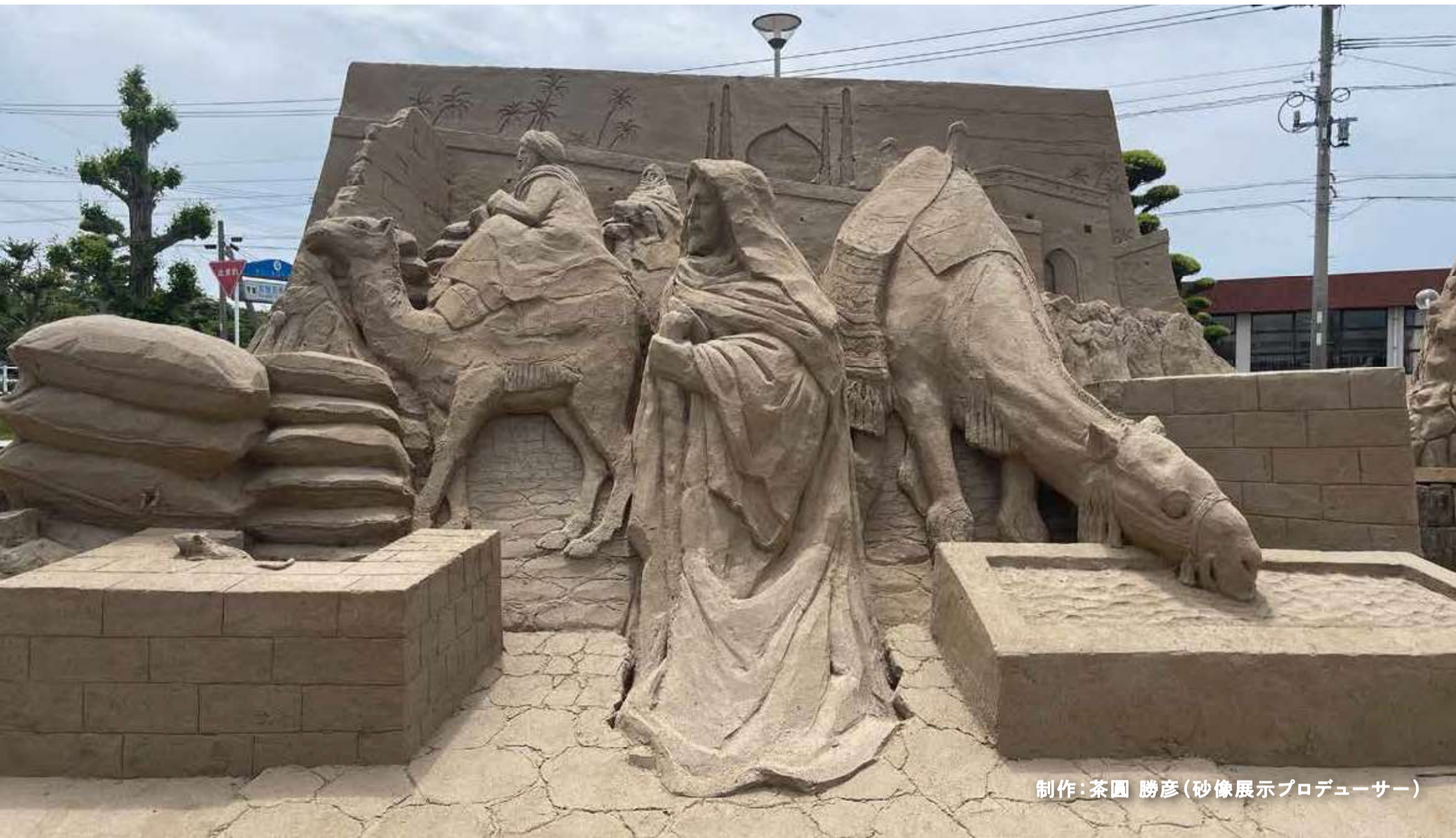
制作: 茶園 勝彦 (砂像展示プロデューサー)