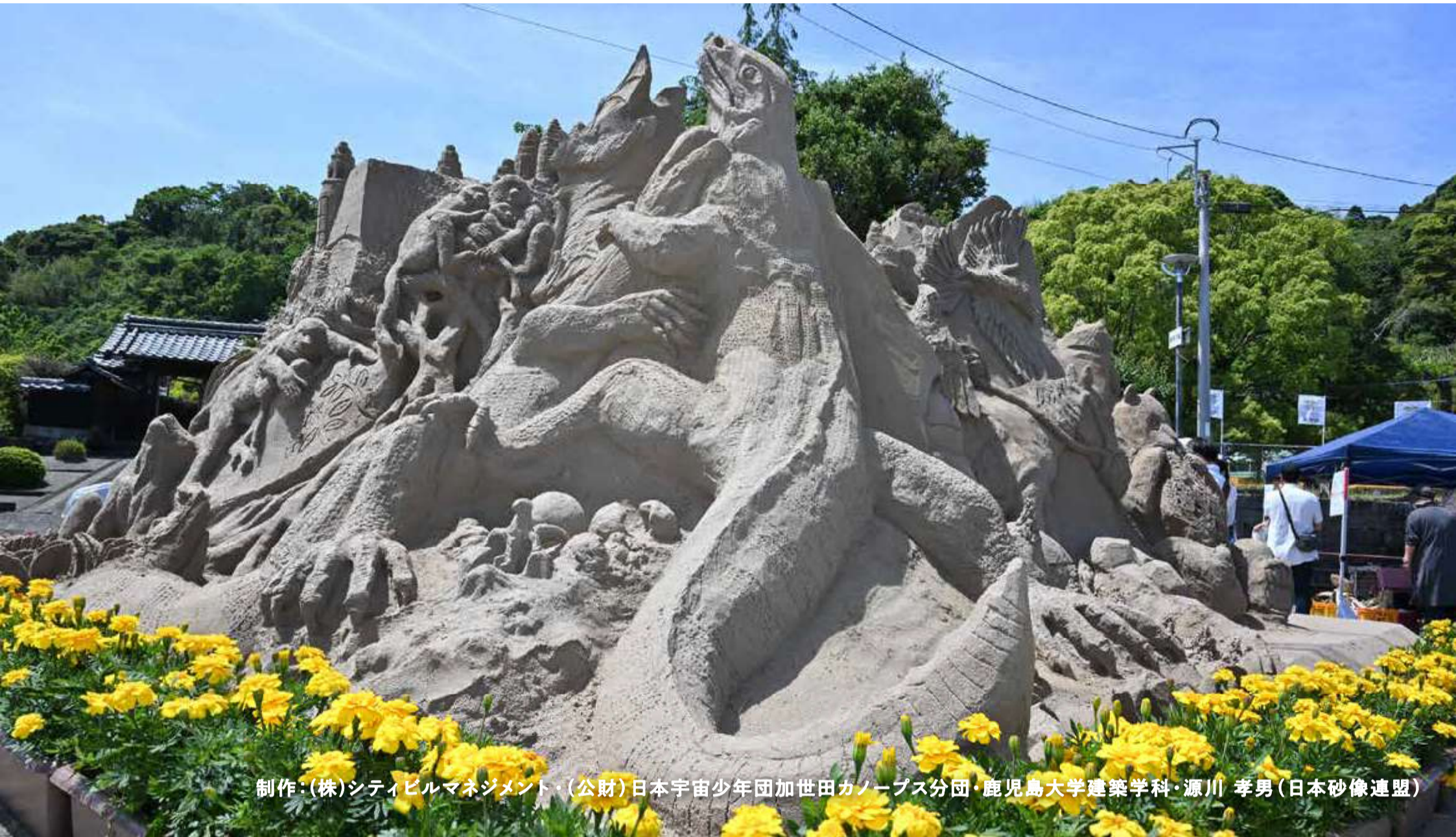
制作：(株)シティビルマネジメント・(公財)日本宇宙少年団加世田カノープス分団・鹿児島大学建築学科・源川 孝男(日本砂像連盟)