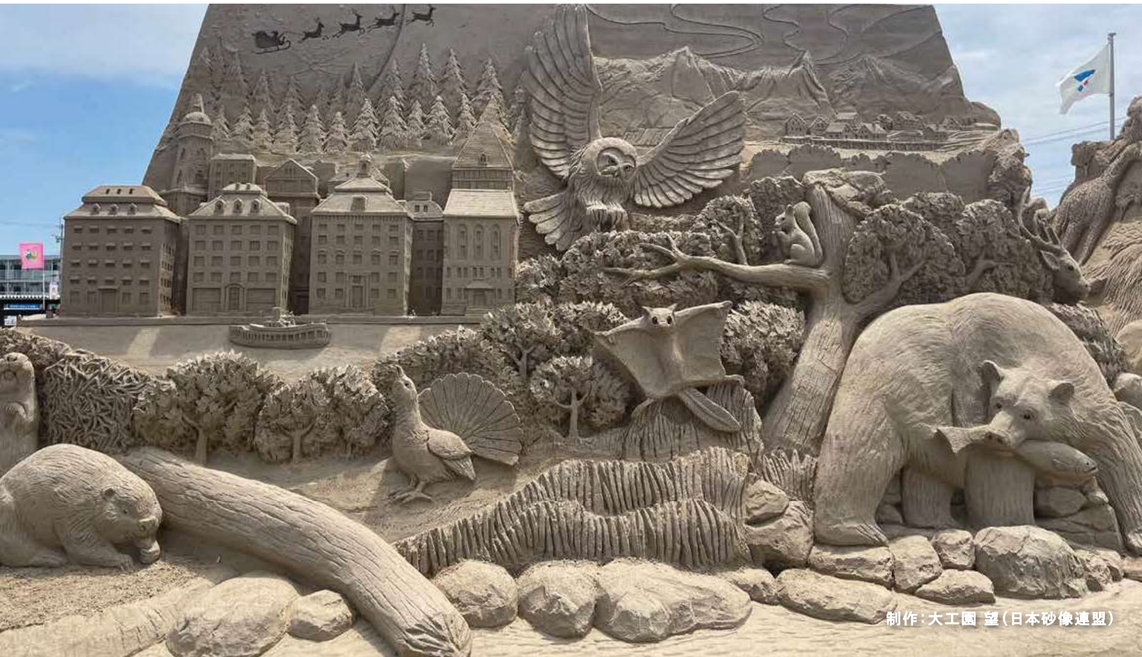
制作：大工園 望（日本砂像連盟）