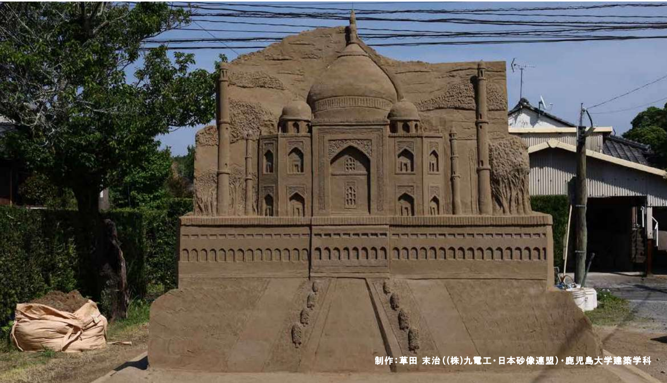
制作:草田 末治((株)九電工・日本砂像連盟)・鹿児島大学建築学科