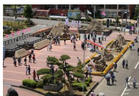
2021年(令和3年) 第34回吹上浜砂の祭典 新型コロナウイルス感染症に対応したイベントとして 「まちなか」での開催