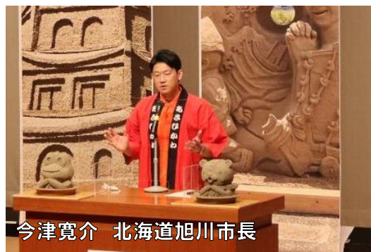
今津寛介 北海道旭川市長