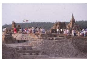
1987年(昭和62年) 第1回吹上浜砂の祭典 日本初の「砂のイベント」を開催

日本初の砂イベント「吹上浜砂の祭典」は、1987年(昭和62年)の第1回開催からこれまで35年間、南さつま地域の知名度アップや交流促進、観光振興など地域活性化に大きな成果をもたらす一方、地域資源を活用したイベントとして各方面からも高い評価をいただいています。