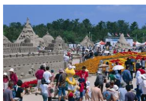
2004年(平成16年) 第17回吹上浜砂の祭典 日本初の「砂の彫刻世界選手権大会」を開催