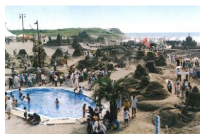
1997年(平成9年) 第11回吹上浜砂の祭典 第1回ふるさとイベント大賞「祭り部門賞」受賞