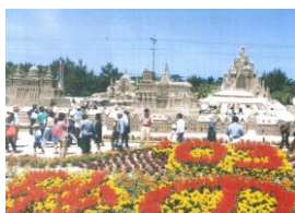
2003年(平成15年) 第16回吹上浜砂の祭典 会場をかせだドーム周辺に移し、リニューアル