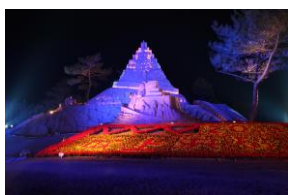
2011年(平成23年) 第24回吹上浜砂の祭典 会場を砂丘の杜きんぽうに移転し、2回目となる 「砂の彫刻世界選手権大会」を開催