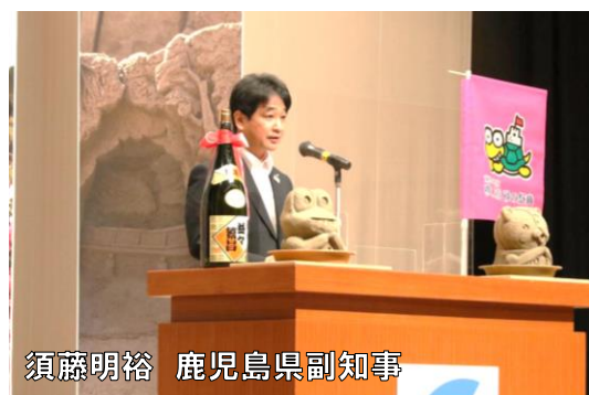
須藤明裕 鹿児島県副知事